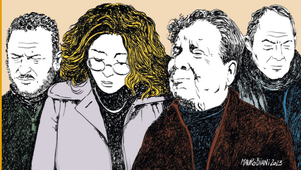
Mauro Biani per Repubblica

GRAZIE AL PESCATORE, ALLA STUDENTESSA, AL MEDICO, ALLA SIGNORA ANZIANA, ALLE CENTINAIA DI PERSONE DI CROTONE, DIGNITÀ D'ITALIA